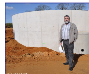
Visite du chantier de la station d'épuration

La commune subit quelques désagréments à l'occasion de travaux nécessaires pour la station d'épuration et le réseau d'eau potable. La pose des canalisations pour la station est achevée, il reste à réaliser les travaux de Lotour, Kervennic et la mise en place d'un collecteur pour le raccordement des habitations de Groez Diben.